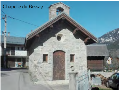
Chapelle du Bessay

1 La chapelle du Bessay est à 750 mètres du chef-lieu de St-Alban en direction de St-Colomban.