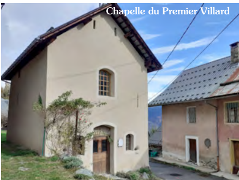
Chapelle du Premier Villard

3 Descendre ensuite vers le bas du hameau où l'on trouvera un panneau indiquant la chapelle des Voûtes que vous atteindrez en 20 mn par un petit sentier. A l'intérieur, une belle Piéta et un tableau Dufour. Le retour se fera ensuite en reprenant le même chemin, ou, pour faire une boucle par la petite route du Premier Villard à Saint-Alban.