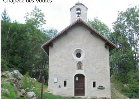
Chapelle des Voûtes

Au cours du 17 e siècle, et durant la première moitié du 18 e siècle, dans chaque paroisse, des particuliers aisés ou groupes de paysans fondent des chapelles ; beaucoup d'entre elles sont construites en exécution d'un vœu fait pour être épargné d'une calamité.