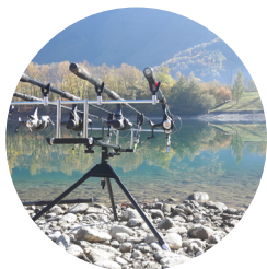
Lac des Hurtières Saint-Alban-d'Hurtières