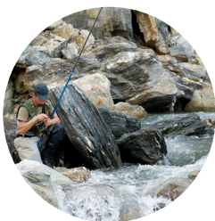
Pêche en rivière