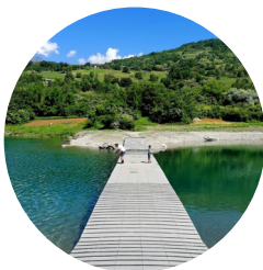
Lac de Barouchat Bourgneuf