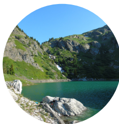
Pêche en lac d'altitude