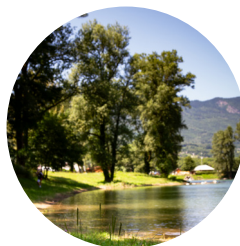
Lac de La Corbière Saint-Pierre-de-Belleville